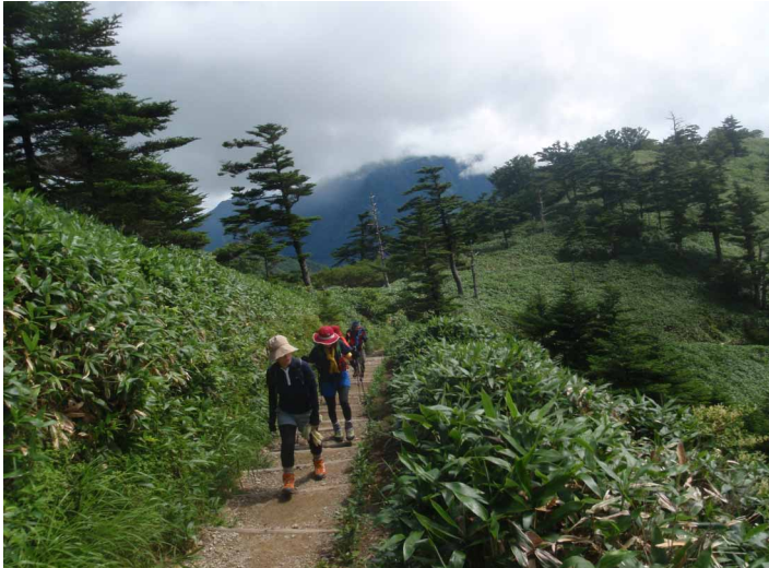
▲ 土小屋からの登山道